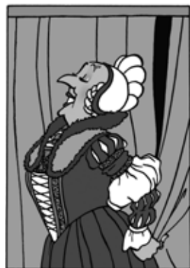
Georges Remi, dit Hergé, Les Aventures de Tintin

Ce concert s'inscrit dans le cadre de la "Journée Famille" de la saison.