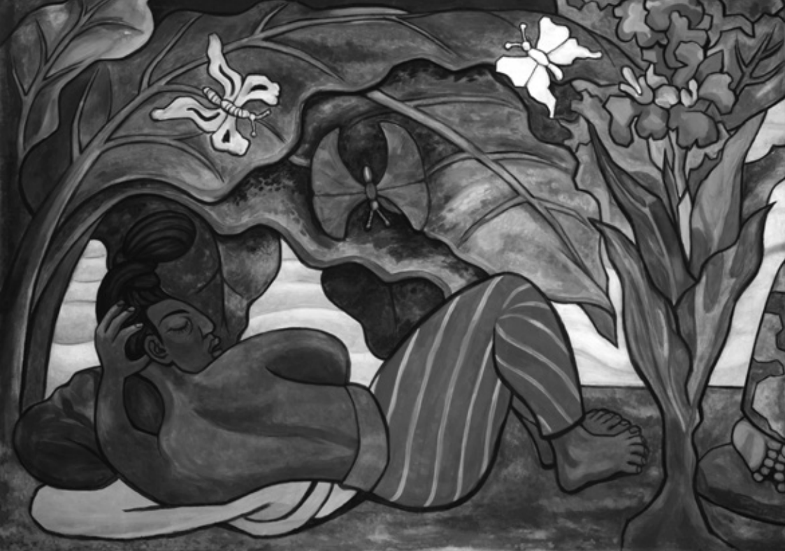
Diego Rivera La Rivière Juchitán 1953-1955, Mexico