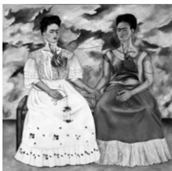
Frida Kahlo Les Deux Frida , 1939, Mexico