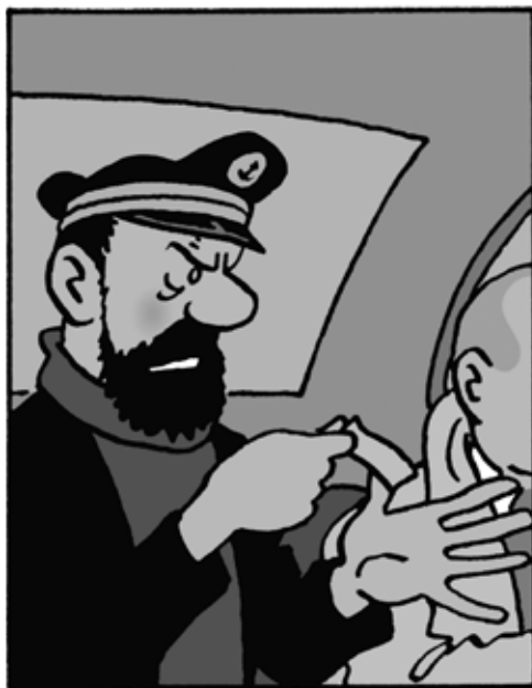
Georges Remi, dit Hergé, Les Aventures de Tintin

à 13h30 les vendredis 18 novembre 2 décembre 13 janvier