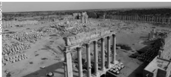
Le temple de Bél aujourd'hui, Palmyre, Syrie