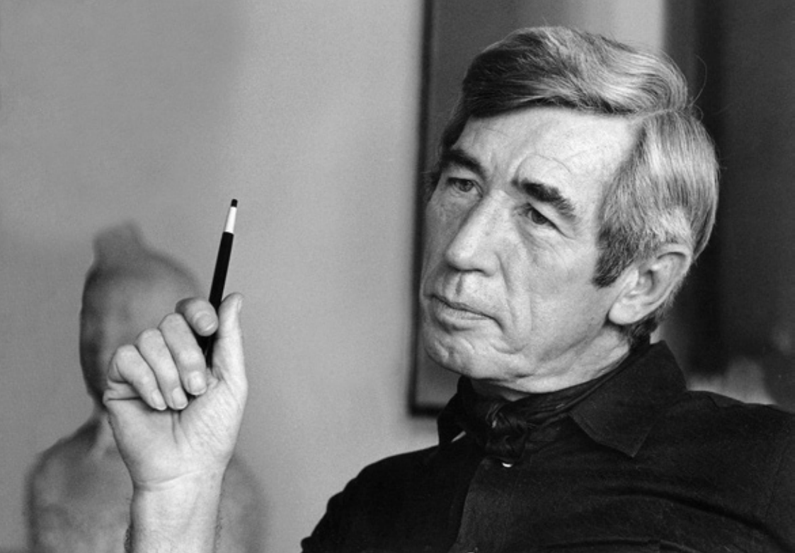
Hergé, Studios Hergé, Bruxelles, 1969