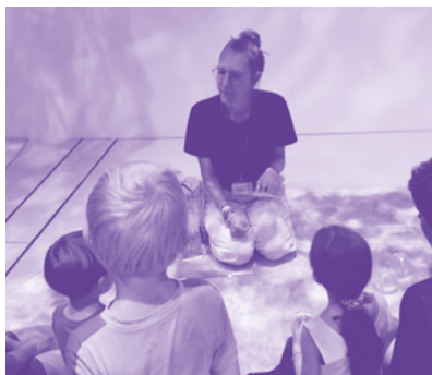
↑ Visite exploration © GrandPalaisRmn.

Informations, tarifs et billetterie sur grandpalais.fr