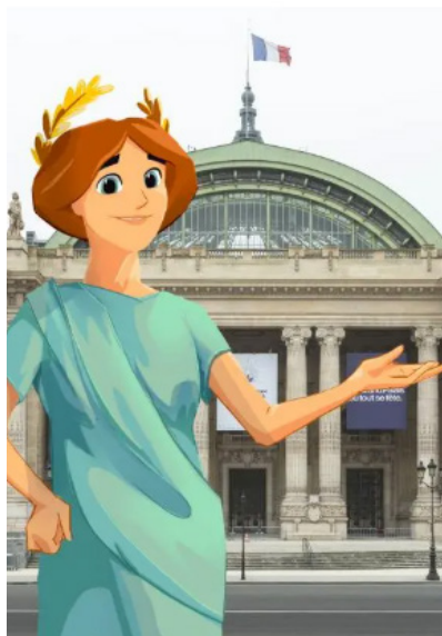
↑ Sauvez le Grand Palais