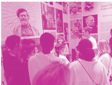
↑ Visite exploration

Informations, tarifs et billetterie sur grandpalais.fr