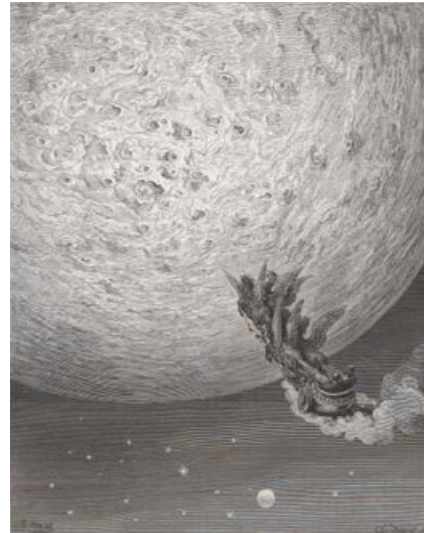
Arioste ROLAND FURIEUX, POÈME HÉROÏQUE

Traduit par A.J. du Pays, illustré par Gustave Doré, 1879, volume imprimé, 1/2 reliure chagrin, 44 x 34 x 7,5 cm. Paris, Bibliothèque nationale de France - Réserve des Livres rares.