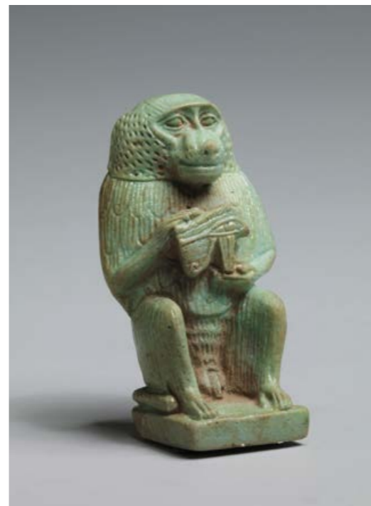
Thot babouin tenant l'oeil oudjat, Basse Époque 7 e - 6 e siècle avant J.-C., faïence égyptienne, 5,7 x 3,2 cm, Paris, musée du Louvre.

de La Jeune Martyre de Delaroche, qui semble sereine.