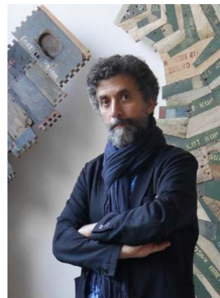
Philippe Malgouyres, Conservateur en chef du patrimoine, Département des objets d'art, musée du Louvre.

Le texte complet de cet entretien sera mis en ligne dans le dossier pédagogique au moment de l'ouverture de l'exposition.