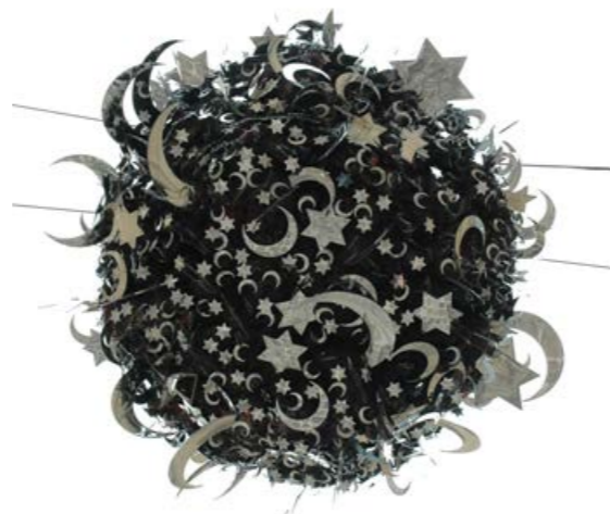
Kader Attia, Big Bang , 2005, boule à facettes, métal, résine, miroir, diam : 1,70 cm, Paris, musée d'Art et d'Histoire du Judaïsme.

La Lune déroute par son aspect changeant et sa disparition 3 jours par mois. Nombre de calendriers sont basés sur les « lunaisons » : dans l'Égypte antique et dans les traditions du Livre. Peu pratique, car comptant 11 jours de moins que l'année solaire, le calendrier lunaire sert au calcul des célébrations religieuses. Malgré leurs différences, l'artiste Kader Attia insiste dans Big Bang sur la mémoire commune aux cultures islamique et hébraïque. La plupart des artistes contemporains s'interrogent davantage sur l'aspect transitoire de la Lune. Dans son installation de télévi-