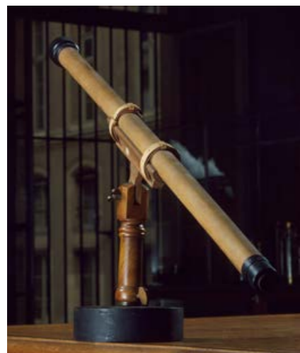
LUNETTE DE GALILÉE, REPRODUCTION 1825-73

Tour à tour apaisante, sensuelle ou inquiétante, la Lune est changeante, imposant aux hommes ses lunaisons; Morellet les évoque de façon aléatoire et sans romantisme dans sa série des « Lunatiques », entamée en 1996.