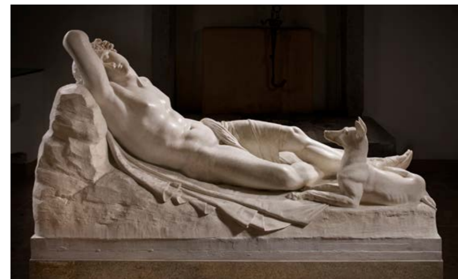
Antonio Canova, Endymion endormi , 1819, plâtre, 93 x 183 x 95 cm, Possagno, Gypsotheca Canoviana.

Paul Verlaine (recueil la bonne chanson , 1872).