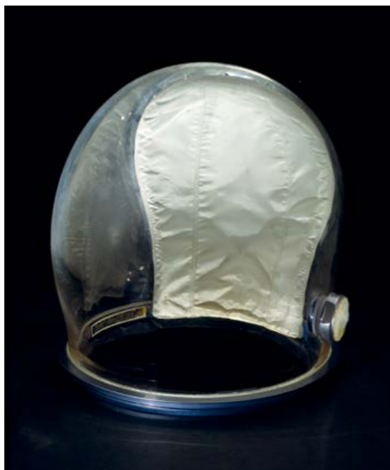
Casque, bulle pressurisée, Collins, Apollo 11, 1969, plastique, aluminium anodisé, 27,6 x 32,7 x 28,6 cm, Washington, Smithsonian National Air and Space Museum.

Dans les années qui suivent le « premier pas sur la Lune », les artistes questionnent cet événement qui a concerné des hommes blancs. La longue absence des femmes est dénoncée par Aleksandra Mir qui met en scène le premier pas d'une femme sur la Lune dans une vidéo (1999). Sylvie Fleury crée des fusées dont la forme évoque la virilité mais aussi des tubes de rouge à lèvres roses et brillants. Yinka Shonibare quant à lui, revendique, avec