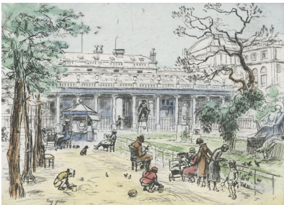
8. Les jardins du Palais-Royal

Claude-Louis Desrais (1746-1816) Louis Lecoq (18e-19e siècle) 1787