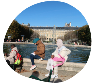
Les élèves dessinent près de la fontaine centrale du jardin.