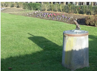
9. Petit canon méridien