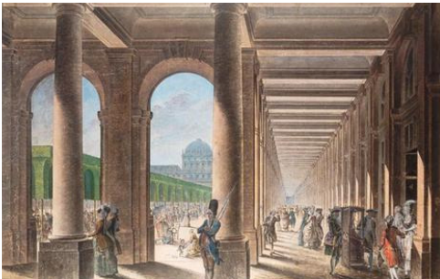
4. Galerie et jardins du Palais-Royal (galerie Montpensier) après 1785