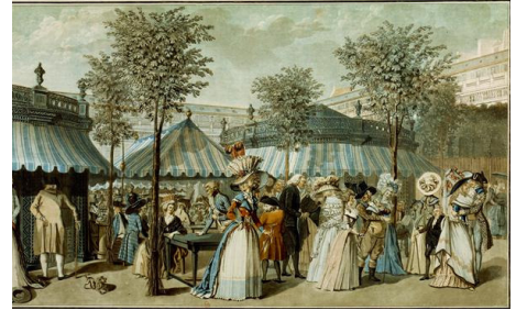
7. Promenade du jardin du Palais-Royal

Le Palais-Royal est alors surnommé " le palais marchand " : c'est, en quelque sorte, le premier centre commercial .