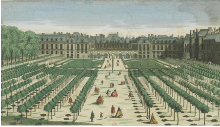
6. Vue Perspective du Palais-Royal du côté du Jardin