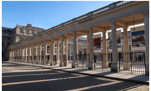
5. Portiques de la Galerie d'Orléans 2021

Depuis sa construction, le Palais-Royal a connu d'importants changements et plusieurs incendies mais il a gardé sa forme générale.