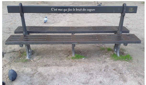
15. Dentelles d'Éternité Michel Goulet (1944) et François Massut 2019

L'artiste, Michel Goulet, utilise les objets du jardin comme support à la poésie . Ces phrases sur les chaises et les bancs accompagnent le promeneur : elles le transportent dans ses rêveries, loin de son quotidien. Maintenant, le jardin du Palais-Royal porte le nom de Jardin des belles lettres .