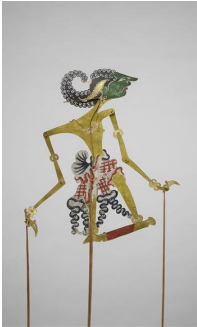
9. Figure du théâtre d'ombres : Prince Arts Asiatiques 19e-20e siècle