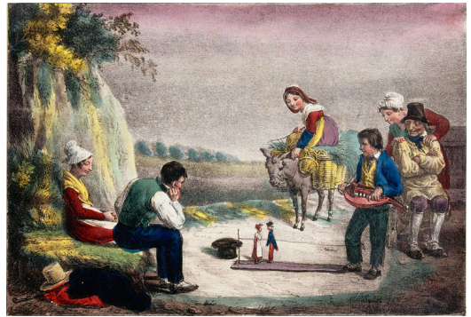
3. Danse des marionnettes Anonyme Art populaire 1827

Sans aucun décor, le marionnettiste, avec une planchette et un fil accroché à son genou, crée l' enchantement .