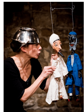
12. L'étoile et le crocodile Compagnie du Soleil des Abysses 2010