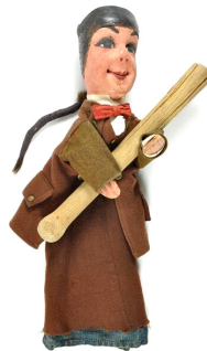
11. Marionnette de Guignol pour le théâtre Guignol-Mourguet Anonyme 20e siècle

En France, Guignol a été inventé pour être le porte-parole du peuple : il amusait le public en se moquant du pouvoir . Aujourd'hui, les marionnettes continuent de nous raconter le monde. Celles de la compagnie du Soleil des Abysses relisent les textes anciens pour nous offrir des leçons de sagesse .