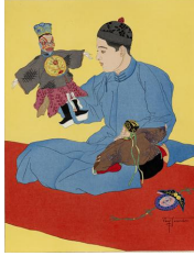
2. Marionnettes chinoises Paul Jacoulet (1896-1960) Avril 1935

La marionnette à gaine est la plus utilisée. Sa tête et ses mains sont cousues sur un petit sac en tissu et le marionnettiste l'enfile comme un gant .