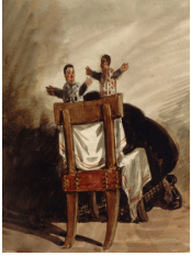
1. Naissance d'un théâtre Maurice Sand (1823-1889) 1847

La marionnette existe depuis très longtemps, sous différentes formes partout dans le monde. Elle est plus présente en Asie et en Europe. C'est une figurine articulée à la main, plate ou en volume. Elle peut être fabriquée en bois, en terre cuite, en tissu, en papier, en cuir, en métal...