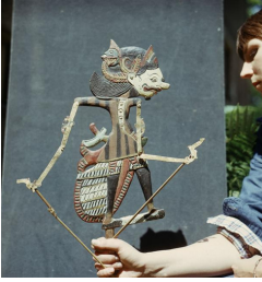
6. Marionnette (Java) Anonyme non daté