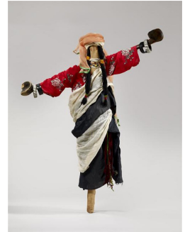
10. "la fiancée de la pluie" Poupée rituelle habillée comme une femme mariée Arts du Maghreb 20e siècle

Le théâtre d'ombres est un spectacle traditionnel et populaire qui vient d'Indonésie. Il est destiné à transmettre des légendes et est utilisé dans beaucoup de pays. Par exemple, Arjuna , la marionnette de gauche, est un des héros de la mythologie indienne. Les marionnettes peuvent aussi être utilisées pour des rites . Par exemple, les femmes berbères mettent en scène Taghenja , la marionnette de droite, pour espérer la pluie.