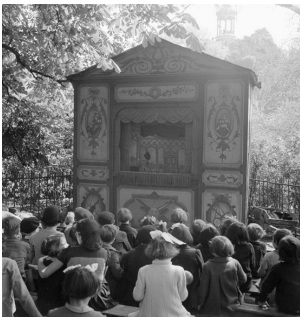
4. Théâtre Anatole des Buttes-Chaumont Anonyme 1 Mai 1944