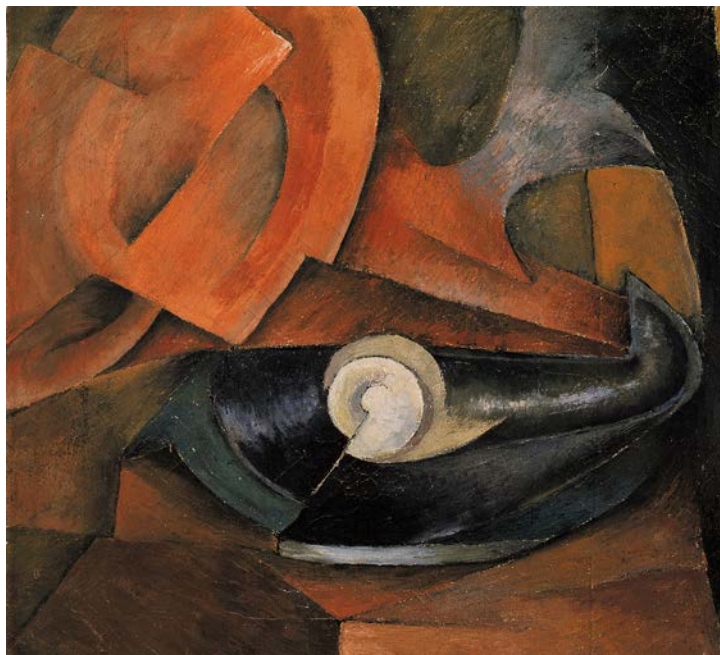
Rufino Tamayo, Le Phonographe, 1925, huile sur toile, 39 x 43 cm, collection particulière.