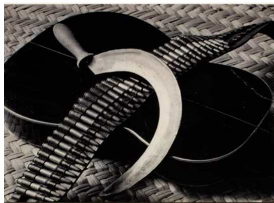
Tina Modotti, Guitarra, canana y hoz, 1927, tirage gélatino-argentique, 19 x 23,5 cm Museo Nacional de Arte, INBA.