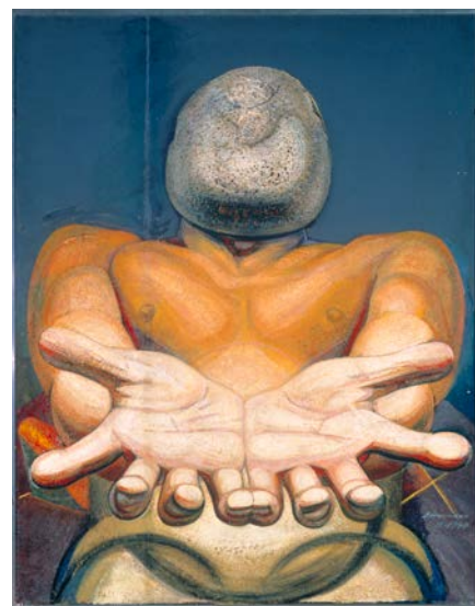
David Alfaro Siqueiros, Nuestra imagen actual, 1947, piroxilina sur celotex et fibre de verre, 223 x 175 cm, Mexico, Museo de Arte Moderno, INBA.

La notoriété du muralisme a souvent éclipsé d'autres artistes proposant une fusion entre différentes formes d'expression comme le théâtre ou la littérature. Le groupe stridentiste, ainsi appelé à cause du grand bruit que celui-ci a suscité dans l'opinion publique des années 1920, présente une alternative originale.