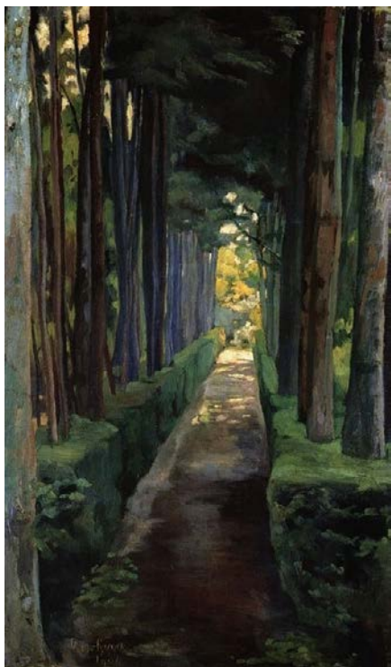
Diego Rivera, Promenade de la Mélancolie (La Castañeda), 1904, huile sur toile, 102 x 68 cm, Mexico, Museo Franz Mayer.

L'exposition présente l'art mexicain de la période préévolutionnaire, à la fin du XIX e siècle, jusqu'au milieu du XX e siècle. Son parcours s'organise autour de quatre sections : Le Mexique avant la Révolution ; Le Mexique et la Révolution ; Les Autres Visages de l'Ecole mexicaine ; Rencontre entre deux mondes : hybridations .