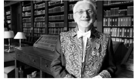
Lucien Clergue en tenue d'Académicien en 2007.

En 2006, il est le premier photographe à être élu à l'Académie des Beaux-Arts.