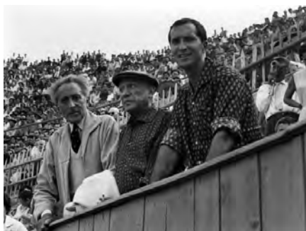
Picasso, Cocteau, Dominguin, 1959, tirage argentique 39,5 x 49 cm.

sensualité. Parmi les œuvres qui ont fait sa renommée, les célèbres séries des Nus de la mer et Nus zébrés , qu'il a enrichi tout au long de sa carrière.