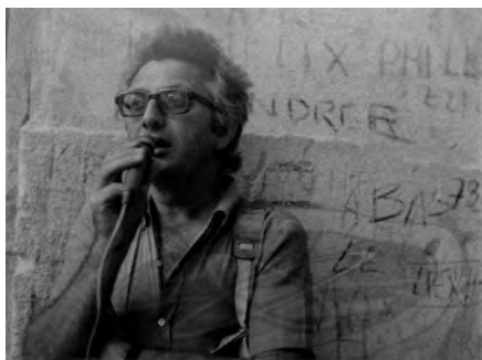
Lucien Clergue aux Baux-de-Provence, lors des Rencontres d'Arles en 1975.