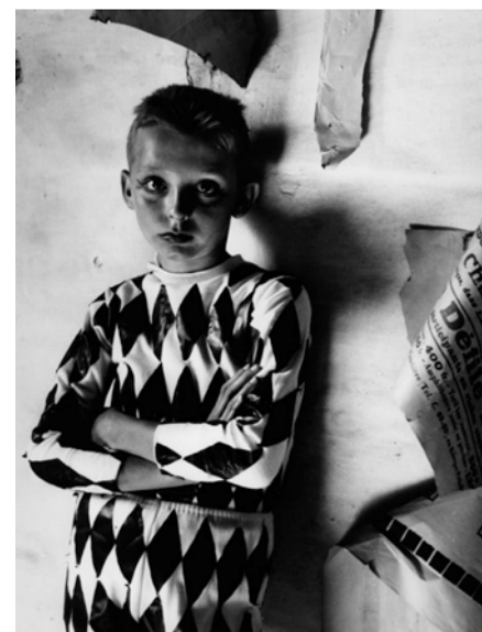
Lucien Clergue, L'Arlequin de la grande récréation , Arles, 1954, 30,1 x 24,3 cm

En 1970, il fonde les Rencontres d'Arles, premier festival de photographie d'envergure internationale en France, avec l'écrivain Michel Tournier et son ami d'enfance